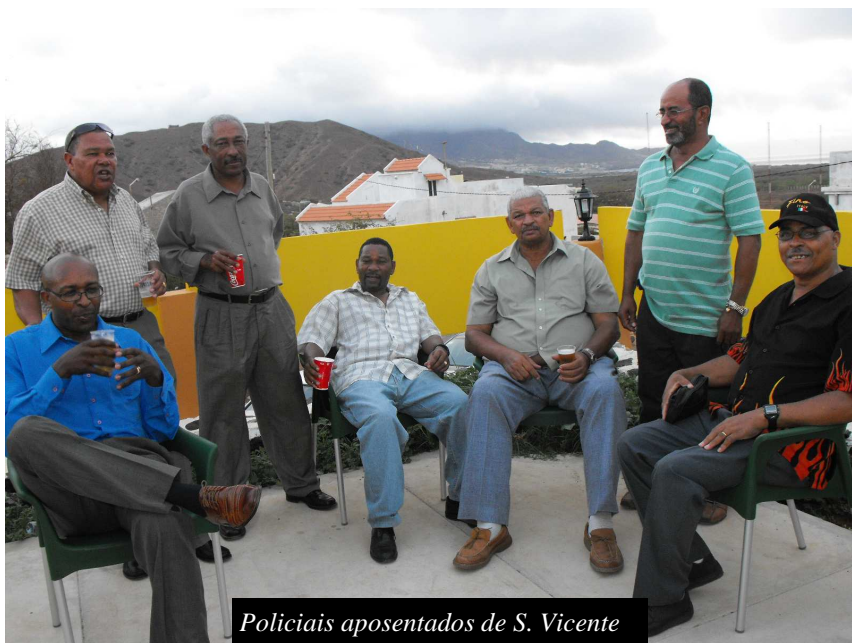
Policiais aposentados de S. Vicente

É de realçar que com a inauguração deste centro social, ficam criadas as condições para a materialização de um dos pontos mais relevantes do referido protocolo de cooperação, que prevê a realização de intercâmbios entre os associados do SS-PSP e do SES da PN.