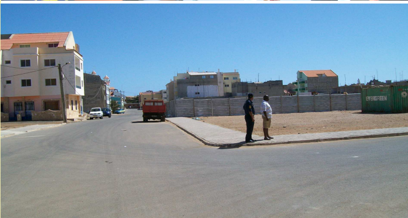
Espaço onde será construída a Esquadra da PN